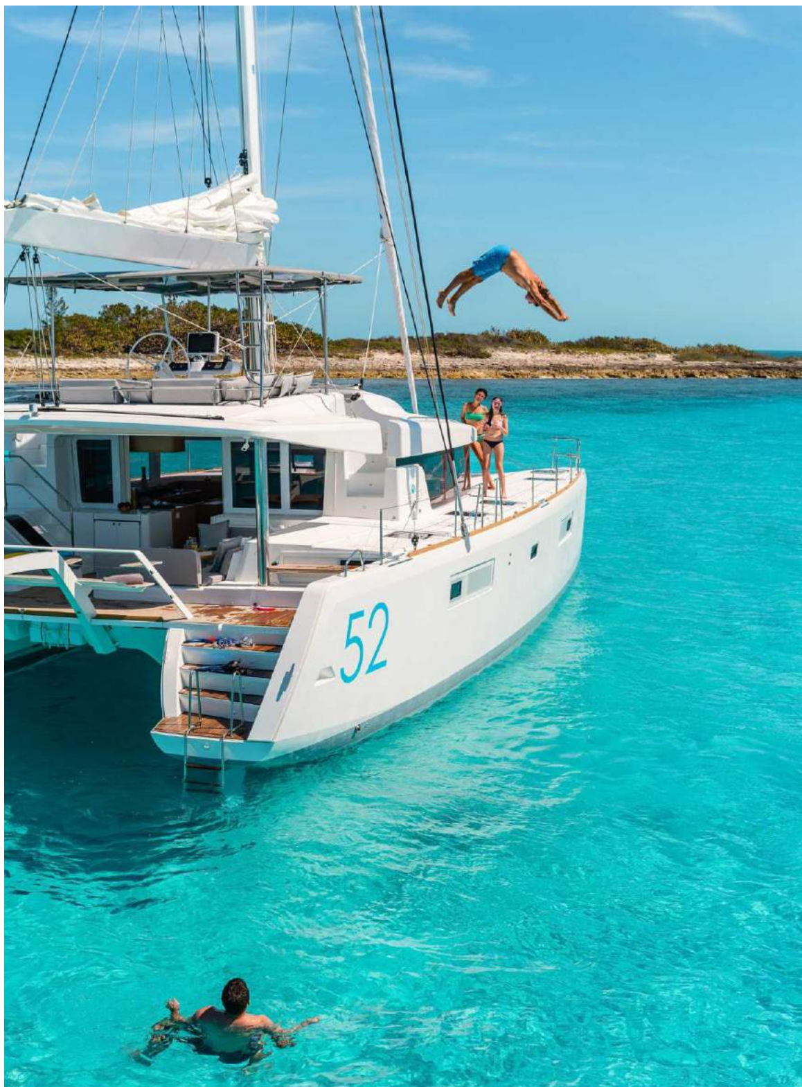
Lagoon 52 - Février 2013

Albatross Yachting e Vacanze è un marchio di Alcat srl Tour Operator - Agenzia di Viaggio