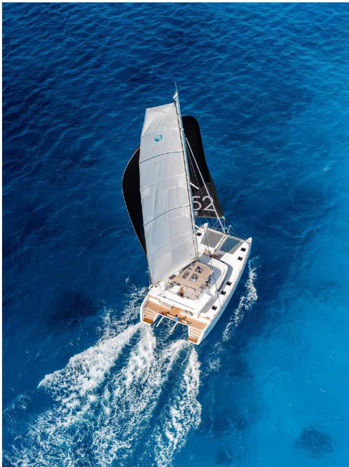
Lagoon 52 - Février 2013 - Mention obligatoire/Mandatory credit: Photo Nicolas Claris

Albatross Yachting e Vacanze è un marchio di Alcat srl Tour Operator - Agenzia di Viaggio